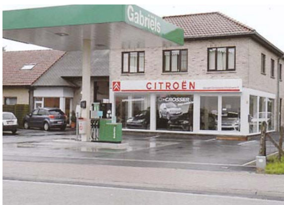
Garage – Carrosserie P. Christiaens Ninoofsesteenweg 105 A - 1744 Leerbeek